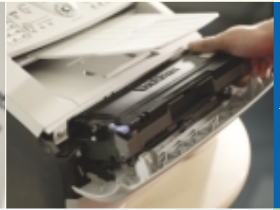
Gescheiden drum en toner