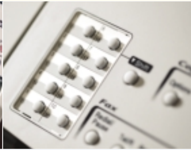
20 direct kiesnummers