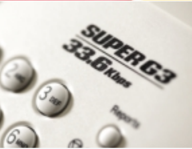
Super G3 laserfax