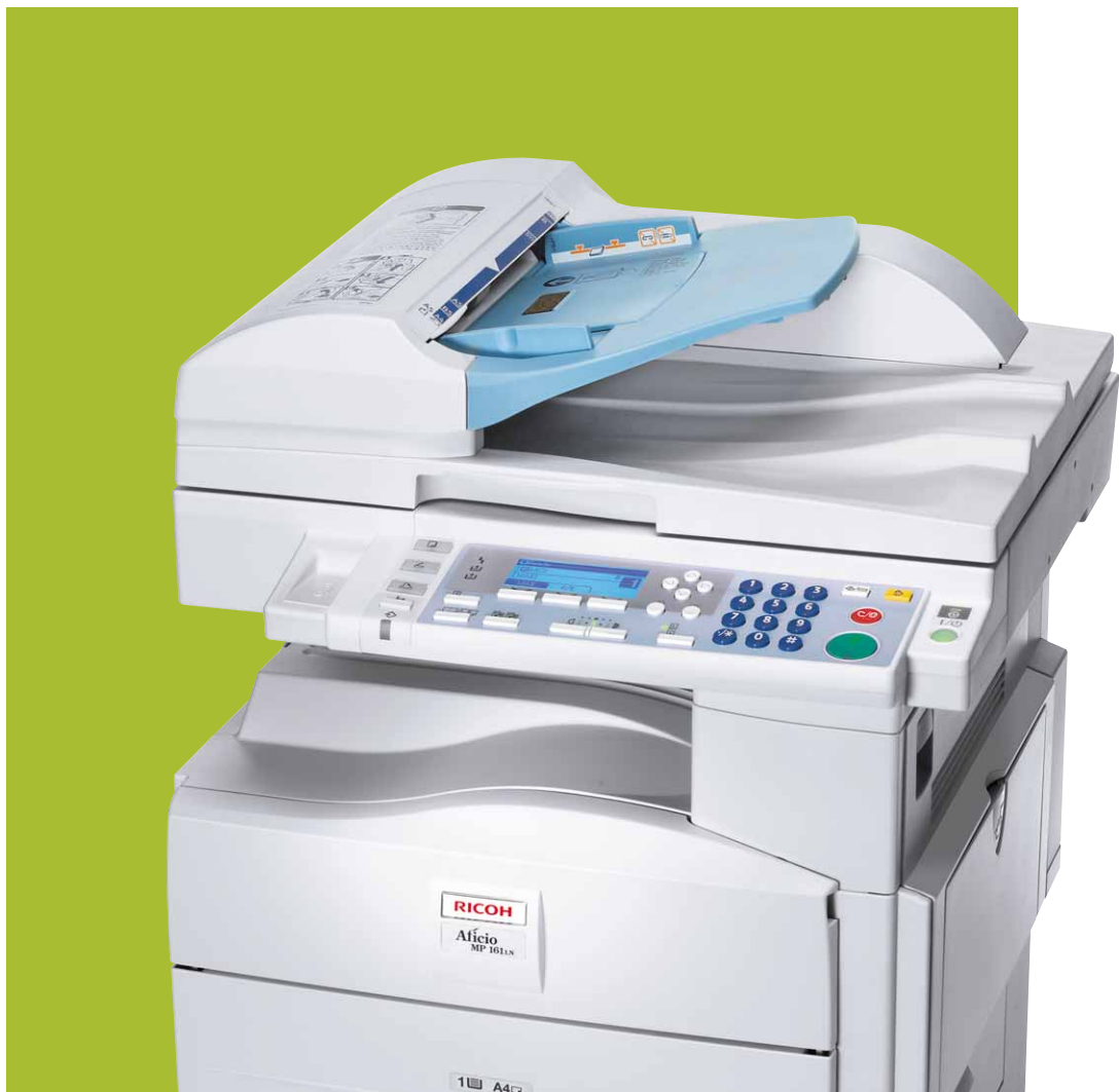
Aficio™ MP 161/MP 161L/MP 161LN