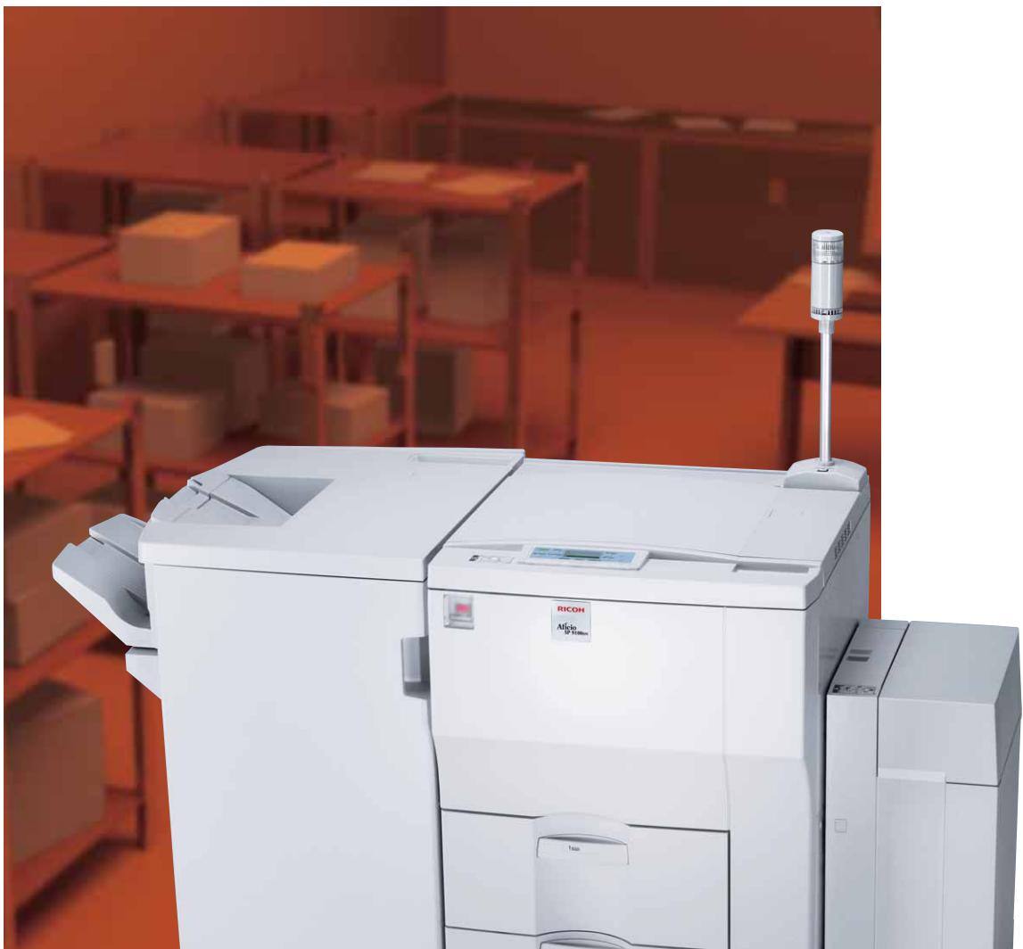
Aficio™ SP 9100DN

Optimaal en betaalbaar printen in zwart-wit